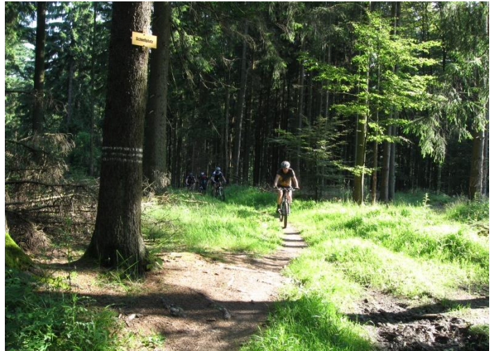
Auf dem Eselsweg

Jetzt erwartet den Mountainbiker das nächste Highlight - ein leicht verblockter Pfad aus Steinen und Wurzeln. Am Ende führt jetzt ein Forstwirtschaftsweg nach Vormwald und weiter geht es auf einem Waldweg nach Kleinkahl. Auf Höhe des Rodberg-Hauses kann man noch einen Abstecher zu einer „Altenburg“ auf dem Reuschberg machen; dies verbunden mit einem heftigen Anstieg.