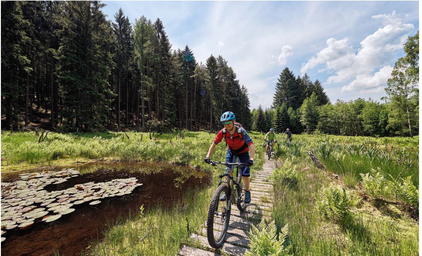
Oben: Das typische Auf und Ab wird im Spessart durch steten Untergrundwechsel versüßt. Unten: Die handgeschapten Trails tragen den offiziellen Flowtrail-Orden der DIMB.