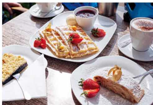
Oben links: ein bisschen Meer im Wald – im alten Gradierwerk rieselt Sole von den Reisigwänden. Der Durchgang ist gratis und soll die Lungen reinigen. Ganz ins Salzwasser eintauchen kann man danach in der Toskana-Therme. Oben rechts: Am Touren-Startpunkt Salinenplatz werden in der Konditorei Kowalski leckere Waffeln serviert.