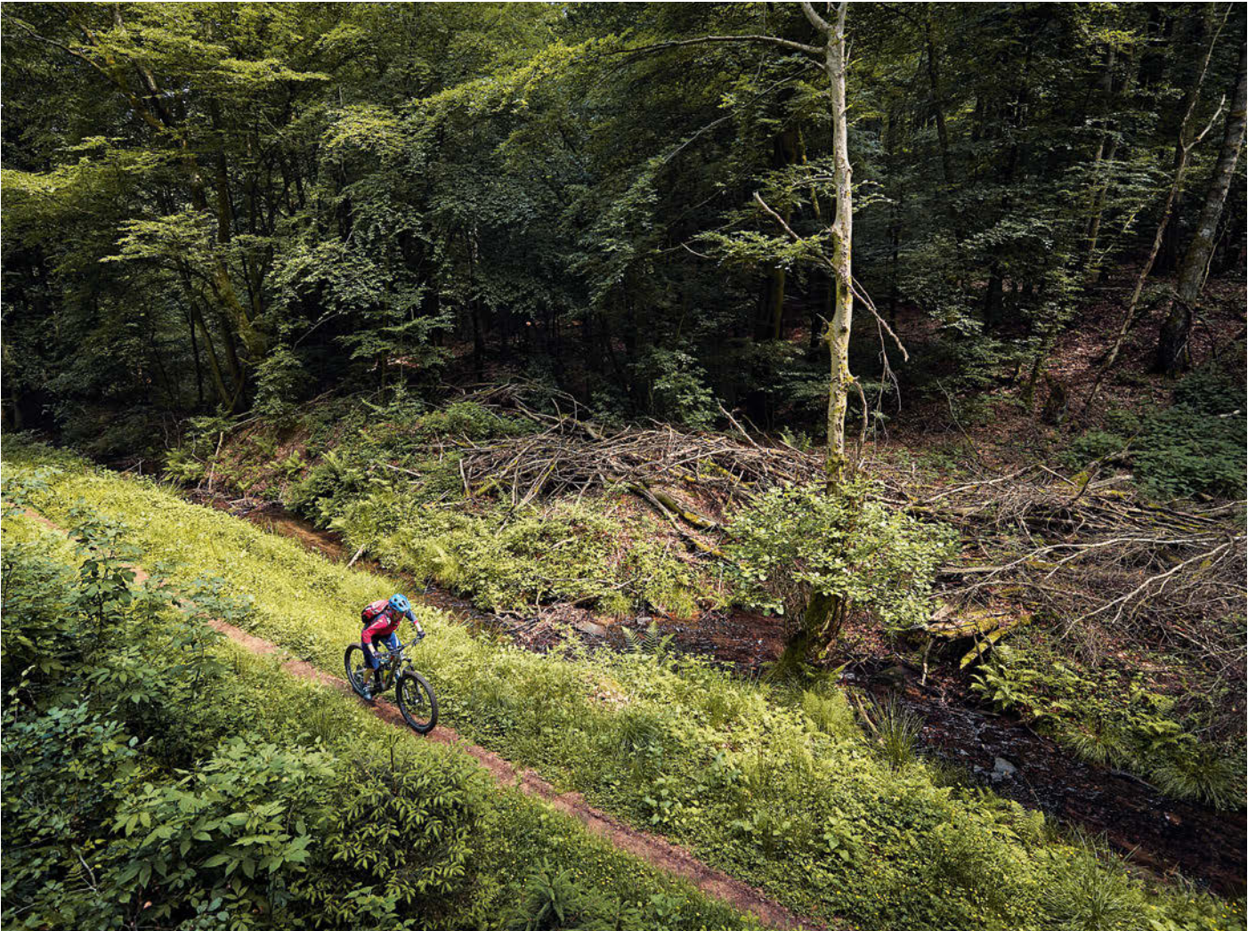
Gerade ging es noch auf trockenen Trails durch den Forst am Horst. Plötzlich wechselt die Vegetation, und man rollt durch sattgrüne Feuchtgebiete. Der Pfad bleibt schmal.

„Premium Biketrail – Flowtrail“ zertifiziert wurde. Und tatsächlich: Der Haseltal-Trail hat alles, was man sich wünscht und lässt das weg, was man sich nicht wünscht. Wellen ja, Bremswellen nein. Roller ja, Rollsplit nein. Die zig Anlieger sind aus satt klebrigem Lehm geshapt, an dem sich die Reifen geradezu festsaugen – er ist wirklich ein Traum von einem Trail. Nach knapp drei Kilometern landen wir auf einem Waldparkplatz. Es gibt eine kleine Naturbühne, und unweit entfernt hat der Turnverein Bad Orb einen Übungsparcours angelegt. Man spürt die Aufbruchstimmung. Eine Schutzhütte ist in Planung. „Hier könnte ein entspannter Treffpunkt entstehen“, nickt Roland und winkt einen der Locals zu sich, der gerade aus dem Trail schießt. Mit Prahlerei haben es sie ja nicht so, die Menschen im Spessart, aber jetzt legt Roland los. Fabian Heim hat gerade den Enduro-One-Auftakt in Winterberg gewonnen. Fabi grinst und betrachtet kopfschüttelnd seine Schuhe. Es ist ihm nicht so angenehm, über sich zu