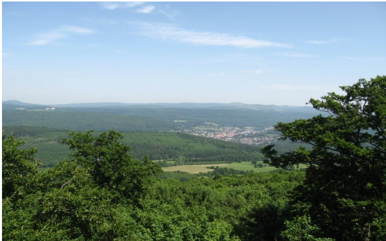
Blick auf Bad Brückenau und Volkersberg

Diese Tagestour führt von Bad Orb zum Dreistelz, einer markanten Erhebung oberhalb von Bad Brückenau. Sie verläuft überwiegend auf Feld- und Forstwirtschaftswegen sowie auf ausgewiesenen Wanderwegen.